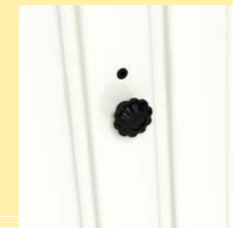
buiten: alleen kapje tbv sleutel zichtbaar