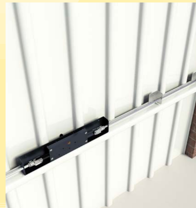
binnen: eenvoudige bevestiging in deurprofiel